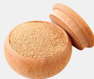
LIEVITO DI BIRRA PROTEZIONE DEL SISTEMA IMMUNITARIO