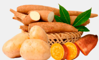
PATATA, MANIOCA, PATATA DOLCE CARBOIDRATI AD ALTA DIGESIBILITÀ