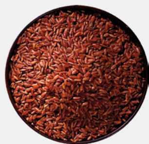
RISO INTEGRALE ALTA DIGERIBILITÀ