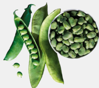
VERDURE PROTEINE E VITAMINE VEGETALI