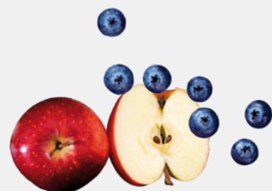
FRUTTA FRESCA ANTIOSSIDANTE