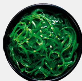
ALGHE MARINE MINERALI ORGANICI NATURALI