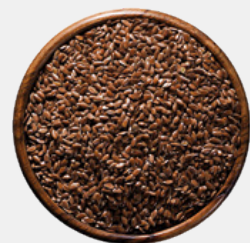
SEMI DI LINO CURA DI PELLE E PELO. OMEGA 3-6