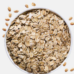
ORZO E AVENA INTEGRALI FONTE DI FIBRA