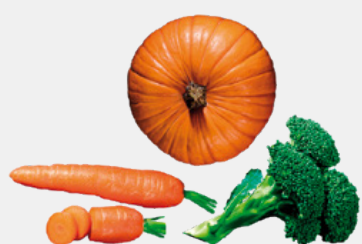
VERDURE FRESCHE ANTIOSSIDANTI