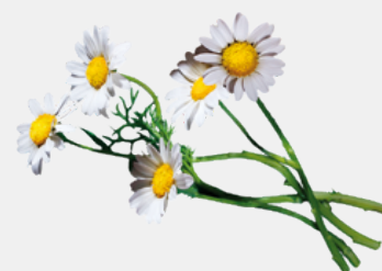
ERBE BOTANICHE BENESSERE DIGESTIVO