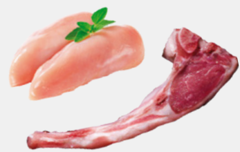
CARNE FRESCA PROTEINA AD ALTO VALORE BIOLOGICO